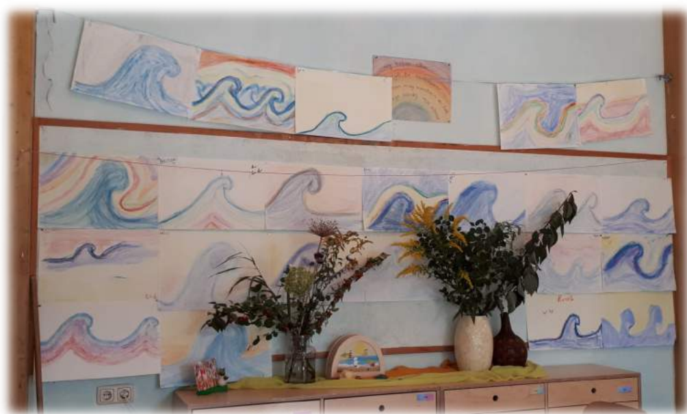
Tekenen met juf Roos in de vierde klas – eerste schooldag

Beste ouders, verzorgers en belangstellenden,